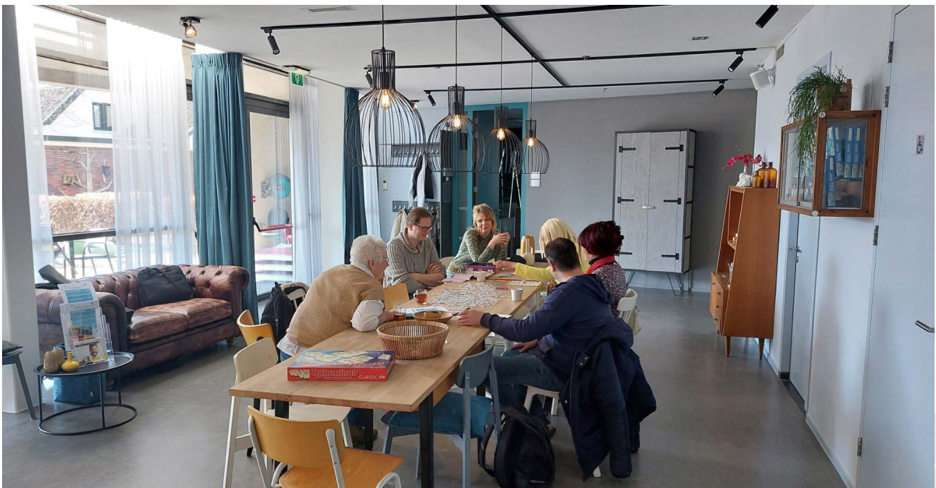
Elke dinsdag- en donderdagmiddag kunnen bezoekers een spelletje spelen of andere (herstel)activiteiten doen.

Via deze QR-code vind je het filmpje op YouTube dat stichting Out of the Box TV voor Vriendendiensten maakte. Of kijk op www.vriendendienstendeventer.nl/nieuws .